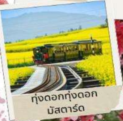
ทุ่งดอกทุ่งดอก มัสตาร์ด