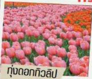
ทุ่งดอกทิวลิป