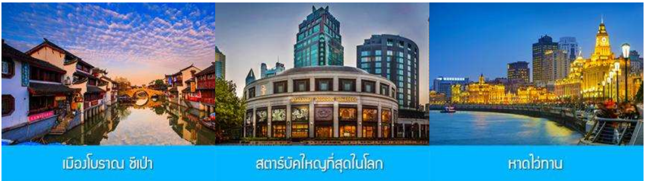
เมืองโบราณ ซิเป่า

พักที่ โรงแรม Liangan Hotel or Holiday Inn Express Hotel 4* หรือเทียบเท่าในเมืองหังโจว