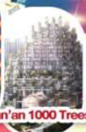
Tian'an 1000 Trees