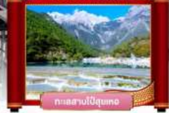
ทะเลสาบไป๋ดูยเหอ