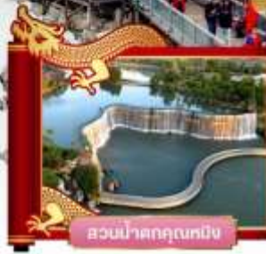
สวนน้ำตกคุนหมิง

✓ พิเศษ! โชว์จางอวี่หมิง "ความประทับใจลี้เจียง"