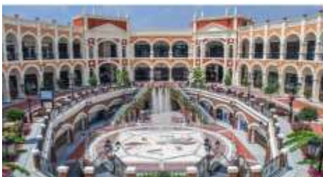
Florentia Village Outlet