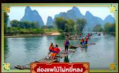
ล่องแพไม้ไผ่ยี่หลง