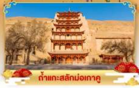
กำแพงสลักม่อเถาตู

เดินทางโดย : สายการบินโซนาอิสิเทิร์นแอร์ไลน์ & เชียงไฮแอร์ไลน์