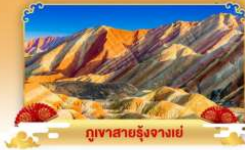
ภูเขาสายรุ้งจางเย่