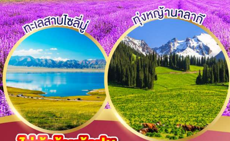
ทะเลสาบโซลึ่มู