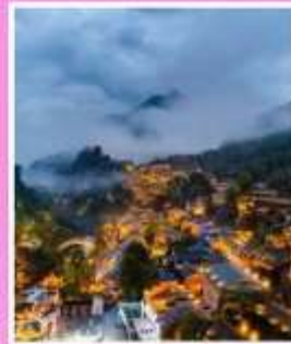
หุบเขาเทวดาวังเซี่ยนทู่