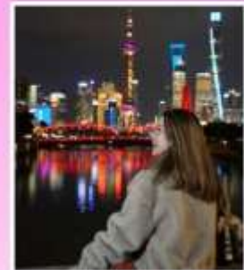
สะพานจ๋าฟู่ตู้เซี่ยอ