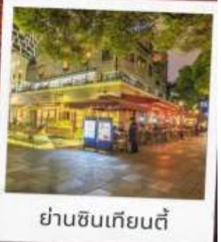
ย่านซินเทียนตี้