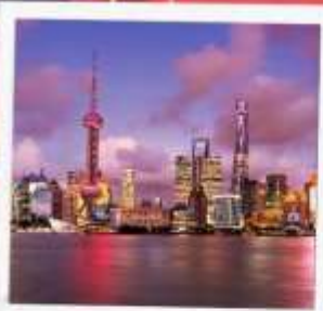
ชั้นหอไข่มุก