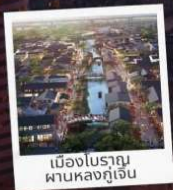
เมืองโบราณ ผานหลงกุเจิน