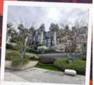
Tian An 1,000 Trees Square