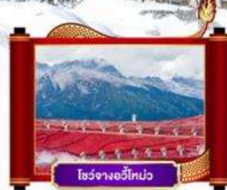
โชว์จางอวี้ไท่ป๋อ