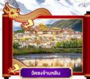
วัดชงจ้านหลิน