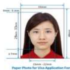
33mm - 35mm Paper Photo for Visa Application Form