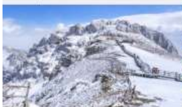
ภูเขาหิมะสีอู๋ซ่า