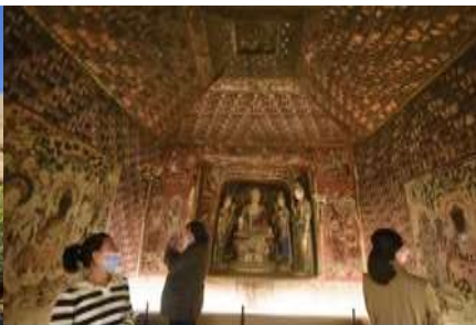
ชมภาพยนตร์ 3 มิติ