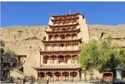
ถ้ำหินมั่วเกาถู

พักที่ METRO PARK HOTEL โรงแรมระดับ 4 ดาวหรือเทียบเท่าในเมือง둔หวง