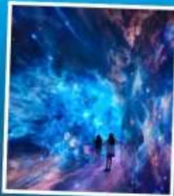
SPACE & TIME CUBE