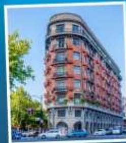
ถนนอู่คัง