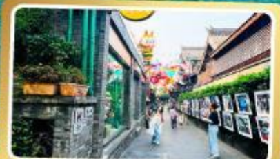
ถนนโบราณชอยกวางชอยแคบ