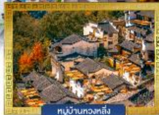
หมู่บ้านหวงหลิ่ง