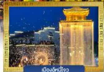
เมืองอู่หนี่โจว