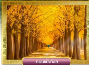
ถนนแปะก๊วย