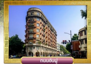
ถนนอันฟู่