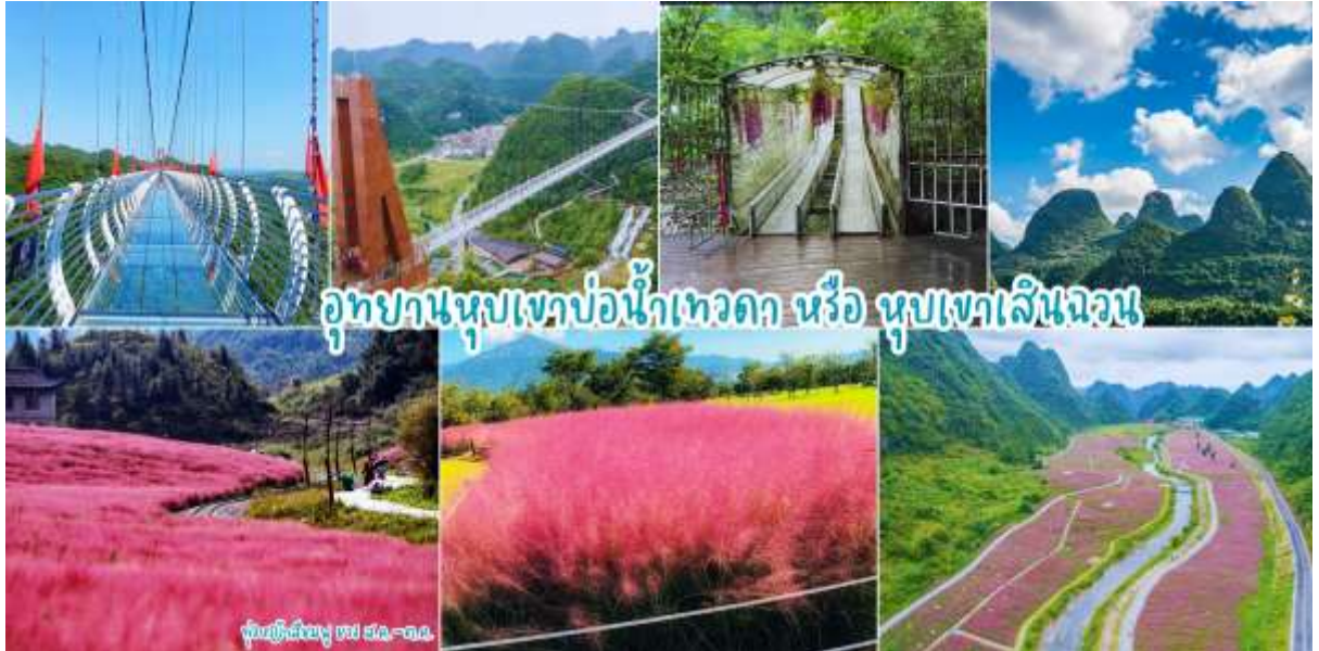
อุทยานหุบเขาบ่อน้ำเทวดา หรือ หุบเขาเสินฉวน

เช้า 📍รับประทานอาหารเช้า ณ ห้องอาหารของโรงแรม