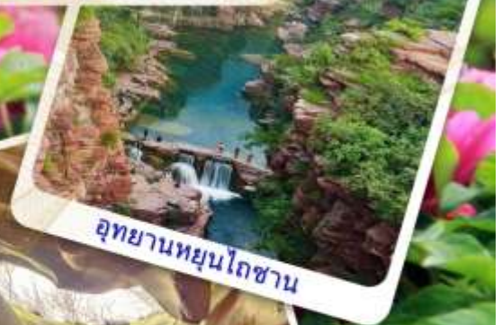
อุทยานหยุนโถซาน

ถ้ำผาลงเหมิน - สวนดอกไม้ต้น - อุทยานหยุนโถซาน - ถ้ำน้ำแข็งหมื่นปี - น้ำตกหูโจว - แกรนด์แคนยอนหยูฉา โกว - สุสานทหารดินเผาฉินซี - กำแพงเมืองซีอาน - ห้าง XIAN MIX C MALL - ถนนคนเดินต้าถิง - POP MART