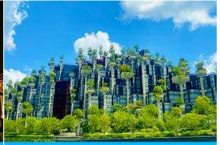
ตึกเทียนอัน (อาคารไม้พันต้น )