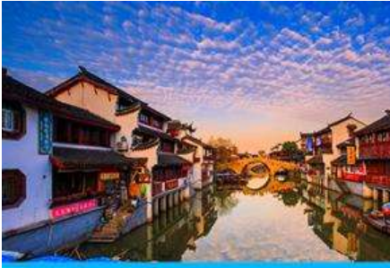
เมืองโบราณ ซิเป่า