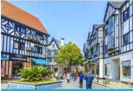
ย่าน เทมส์ทาวน์