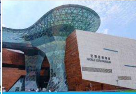
พิพิธภัณฑ์งานเอ็กซ์โป