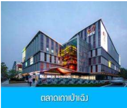
ตลาดเกาเป่าเจิง

พักที่ โรงแรม Luna Garden Hotel or Holiday Inn Express Hotel 4* หรือเทียบเท่าในเมืองเซี่ยงไฮ้