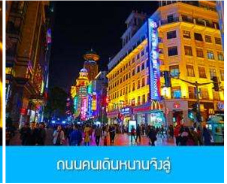
ถนนคนเดินหนานจิงลุ่