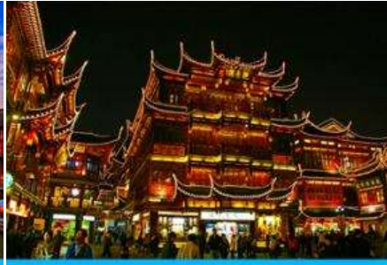
ย่านเจิงหวงเมี่ยว