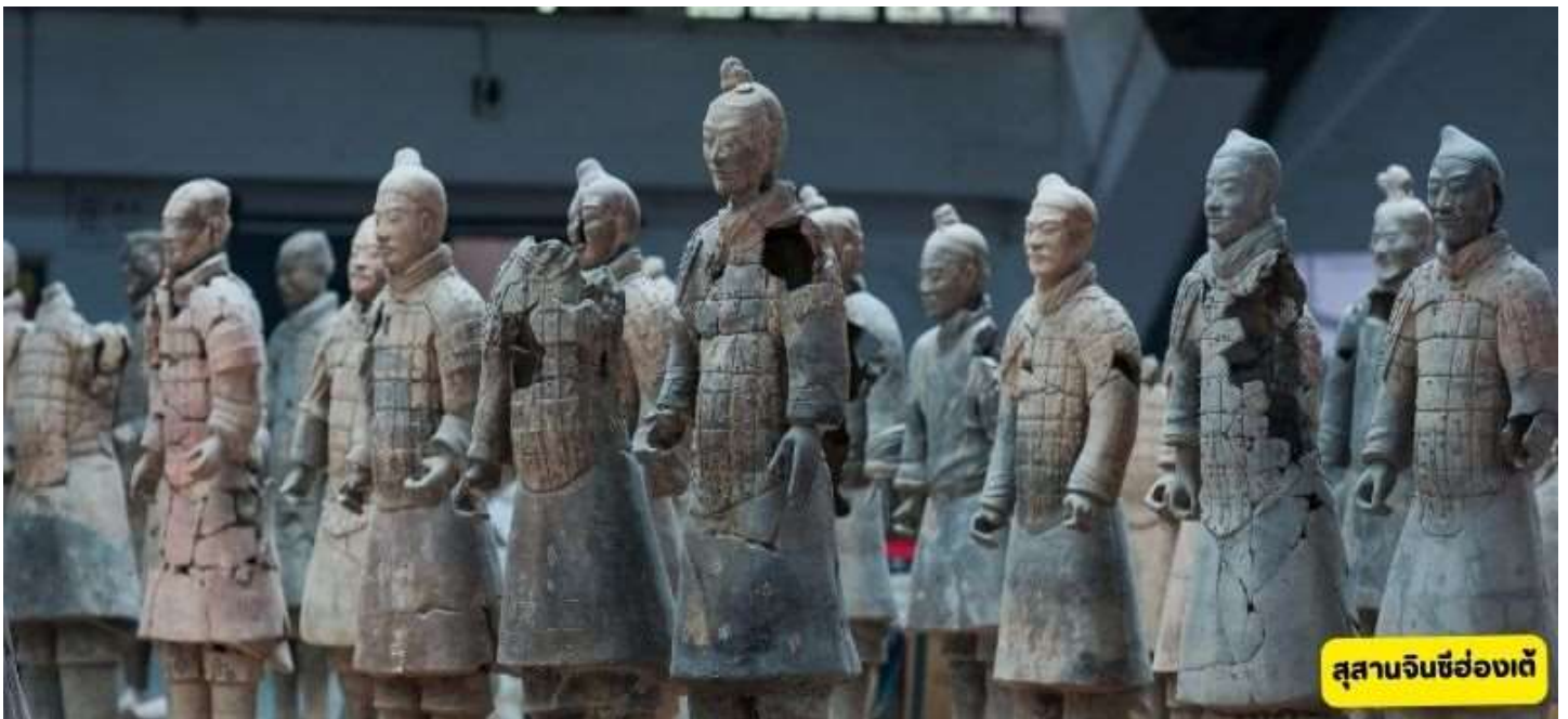
สุสานจินซีฮ่องเต้

สุสานจินซีฮ่องเต้ - วัดต้าฉือเอิน - เจดีย์ห่านป่าใหญ่ - ถนนต้าถ้งเมืองที่ไม่เคยหลับไหล