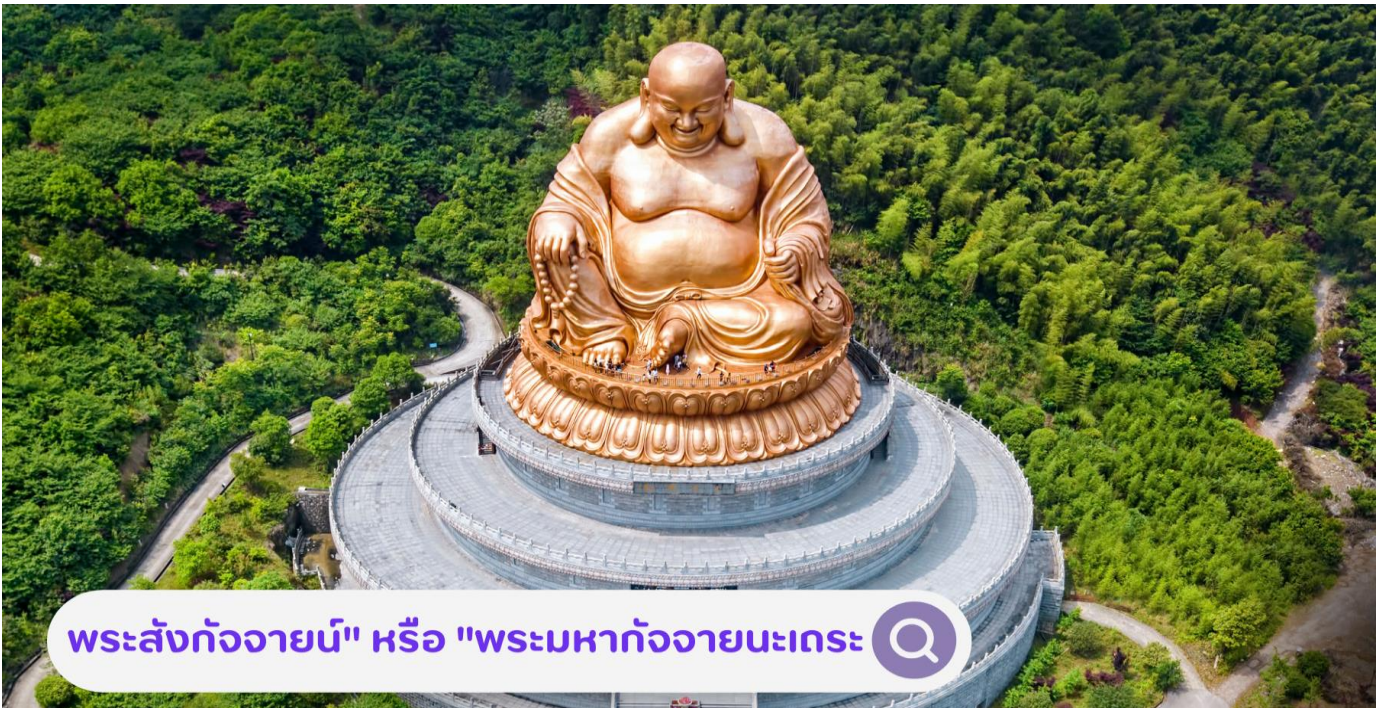
พระสังกัจจายน์" หรือ "พระมหากัจจายนะเถระ" 🔍

นำท่านชม วัดเสวียโต้วซาน ตั้งอยู่ในเมืองหนิงโป มณฑลฝูเจี้ยน ตั้งอยู่ที่เชิงเขาเซาเวาโต้ว (Xuedou Mountain) วัดนี้มีชื่อเสียงในฐานะสถานที่ศักดิ์สิทธิ์สำหรับการศึกษาพุทธศาสนา การและสถานที่ฝึกฝนและปฏิบัติธรรมตามหลักของพระศรีอารยเมตไตรย ซึ่งเป็นพระโพธิสัตว์ที่สำคัญในศาสนาพุทธ ที่วัดมีพระพุทธรูปขนาดใหญ่ที่ตั้งอยู่กลางแจ้ง พระสังกัจจายน์ หรือ "พระมหากัจจายนะเถระ" ขนาด 33 เมตร เมตร มีลักษณะที่งดงามและประณีต พระพุทธรูปนี้สร้างขึ้นด้วยวัสดุที่ทนทานและมีความสวยงามทางศิลปะ เป็นพระโพธิสัตว์ที่สำคัญในศาสนาพุทธ พระองค์เป็นสัญลักษณ์ของความเมตตาและการกรุณา และถูกเคารพสักการะว่าเป็นพระโพธิสัตว์ รอทที่จะมาตรัสรู้เป็นพระพุทธเจ้าองค์ถัดไปเมื่อสิ้นพุทธกาลของสมเด็จพระสัมมาสัมพุทธเจ้า นอกจากนี้ยังมีสถานที่อื่น ๆ ในวัดที่น่าสนใจ เช่น หอพระธรรม พิพิธภัณฑ์ และสวนและทางเดินที่สวยงาม