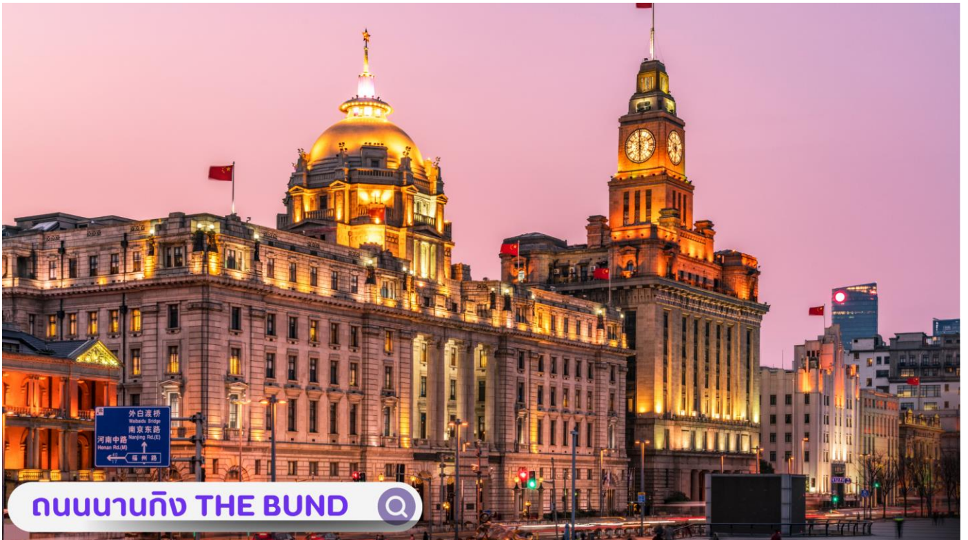
ถนนนานจิง THE BUND

**อิสระอาหารเย็นเพื่อความสะดวกในการท่องเที่ยว**