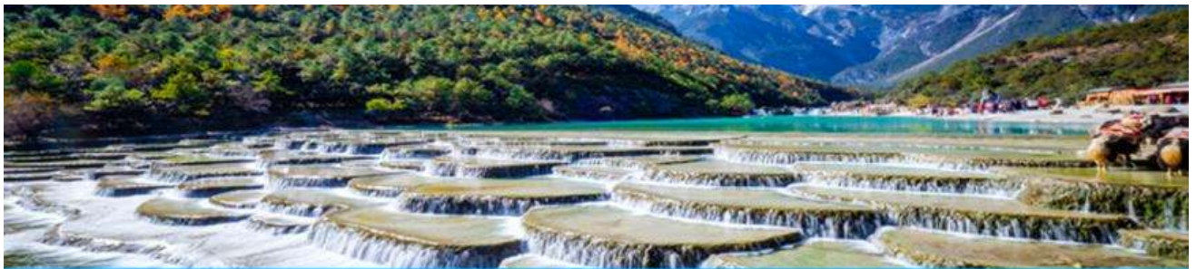
หุบเขาพระจันทร์สีน้ำเงิน Blue Moon Valley

หมายเหตุ กรณีที่กระเซ็นใหญ่ขึ้นภูเขาหิมะมังกรหยกปิดให้บริการ ด้วยเหตุที่สภาพอากาศไม่เอื้ออำนวย หรือเป็นการปิดเพื่อตรวจสอบสภาพและซ่อมแซมประจำปี ทางทัวร์ขอสงวนสิทธิ์ที่จะจัดโปรแกรมขึ้นกระเซ็น ที่จุดชมวิวกุเขาหิมะมังกรหยก ณ สถานีกระเซ็นหุบเขาผิง แทน