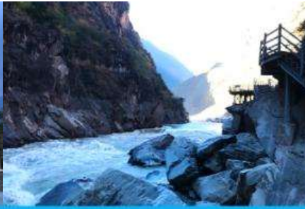
ช่องแคบเสือกระโจน