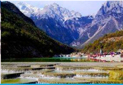
หุบเขาพระจันทร์สีน้ำเงิน "ไป๋ส่วยเหอ"