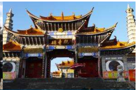
วัดเจ้าแม่กวนอิมเปลงกาย