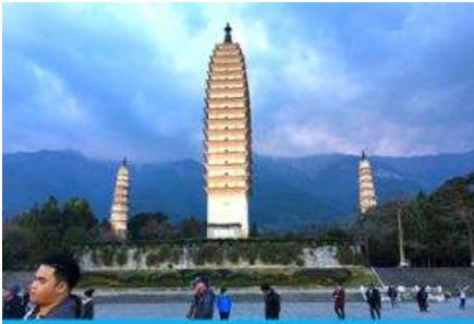
เจดีย์สามองค์