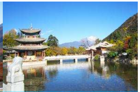
สะพานมังกรดำ

วันที่สี่ เมืองแซงกรี่ล่า – วัดชวงจ้านหลิง – เดินทางสู่เมืองลี่เจียง – สระน้ำมังกรดำ- ศูนย์จำหน่ายผลิตภัณฑ์ ยางพารา- เมืองโบราณลี่เจียง