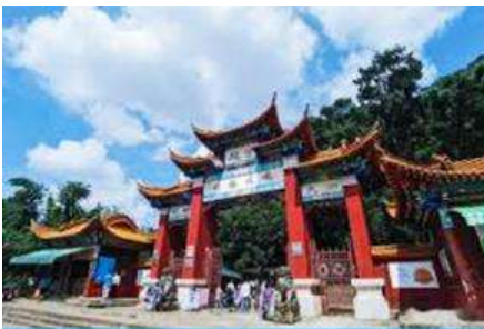
ตำหนักทงจินเตียน