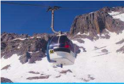
ภูเขาหิมะมังกรหยก (น้ำกระเซ็นใหญ่)