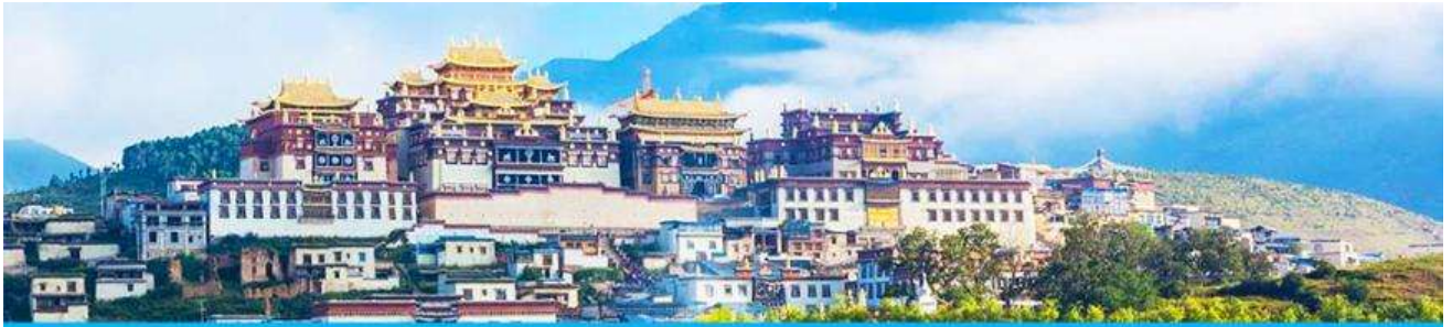
เมืองโบราณแซงกรี่ล่า