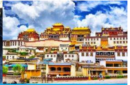
เมืองเซกกรี่ล่า