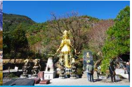
อุทยานน้ำหยก

วันที่ห้า ภูเขาหิมะมังกรหยก(รวมกระเซ็นใหญ่ขึ้น ลง) –หุบเขาพระจันทร์สีน้ำเงิน(ไป๋ส่วยเหอ) –ชมการแสดง THE IMPRESSION OF LIJIANG อุทยานน้ำหยก –ศูนย์สมุนไพรจีน- เดินทางสู่เมืองคู่สูง