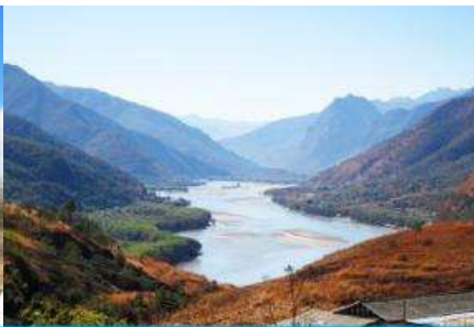
โค้งแรกแม่น้ำแยงซี