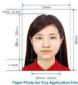
Paper Photo for Visa Application Form