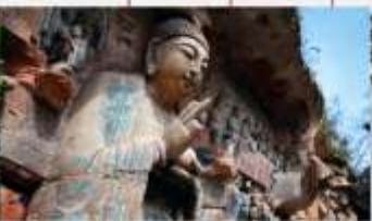
ผาคินแกะสลักต้าจู้ เขาเป่าตึงซาน