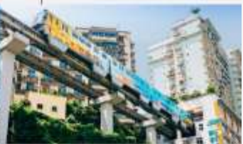
รถไฟฟ้าทะเลตุ๊ก

*ทางบริษัทฯ ขอสงวนสิทธิ์ในการสลับโปรแกรมทัวร์ตามความเหมาะสมขึ้นอยู่กับสถานการณ์ปัจจุบัน โดยคำนึงถึงผลประโยชน์ของลูกค้าเป็นหลัก