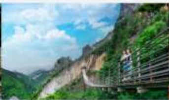
หุบเขารอยแยกอุ๋หลิงซาน