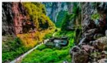
อุทยานแห่งชาติหลุมฟ้า 3 สะพานสวรรค์