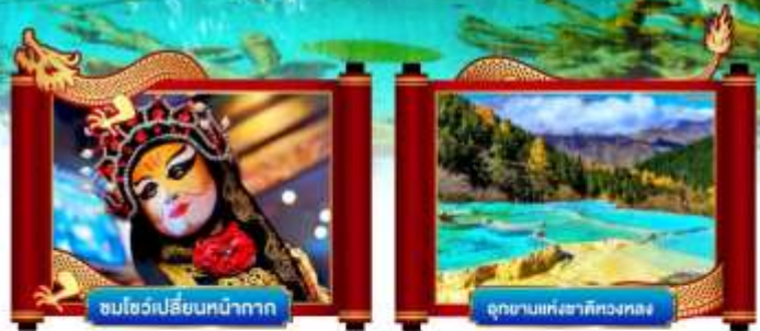
ชมโชว์เปลี่ยนหน้ากาก