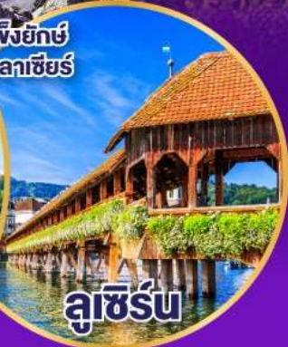
ลูซิิร์น