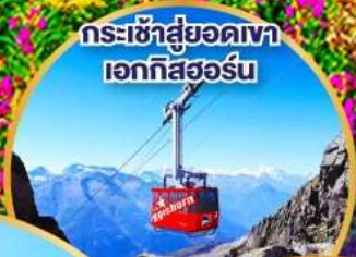
กระเช้าสู่ยอดเขา เอวกทิสฮอร์น

รถไฟกลาเซียร์เอ็กซ์เพรส รถไฟด่วนที่ช้าที่สุด