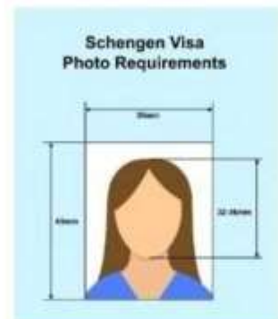
ตัวอย่างรูปถ่าย