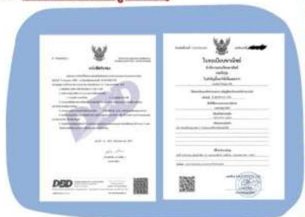
ตัวอย่างหนังสือจดทะเบียนบริษัท และ ใบทะเบียนพาณิชย์