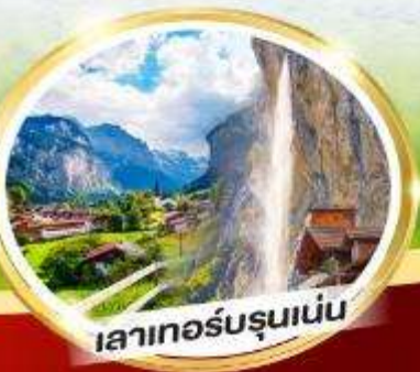
เลาเทอร์บรุนเนน