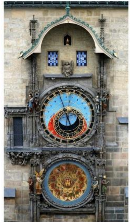
นาฬิกาใช้ท็อคลิคเค่นทรัม

นำท่านชม บ่อหมีสีน้ำตาล สัตว์ที่เป็นสัญลักษณ์ของกรุงเบิร์น นำท่านชม มาร์กาสเซ ย่านเมืองเก่า ปัจจุบันเต็มไปด้วยร้านดอกไม้และบูติก เป็นย่านที่ปลอดภัย จึงเหมาะกับการเดินเที่ยวชมอาคารเก่า อายุ 200-300 ปี นำท่านลัดเลาะชม ถนนจุงเคอร์นกาสเซ ถนนที่มีระดับสูงสุดของเมืองนี้ ซึ่งเต็มไปด้วยร้านภาพวาดและร้านขายของเก่าในอาคารโบราณ ชม นาฬิกาใช้ท็อคลิคเค่นทรัม อายุ 800 ปี ที่มีโชว์ให้ดูทุกๆชั่วโมงในการตีบอกเวลาแต่ละครั้ง หอนาฬิกาแห่งนี้ ในช่วงปี ค.ศ. 1191-1256 ใช้เป็นประตูเมืองแห่งแรก ภายหลังได้ดัดแปลงใช้ท็อคลิคเค่นทรัมให้กลายมาเป็นหอนาฬิกาพร้อมติดตั้งนาฬิกาดาราศาสตร์เข้าไป