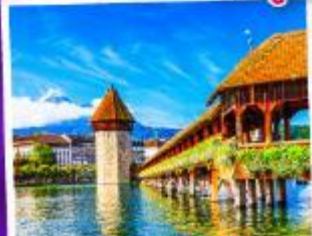
ลูซิิร์น