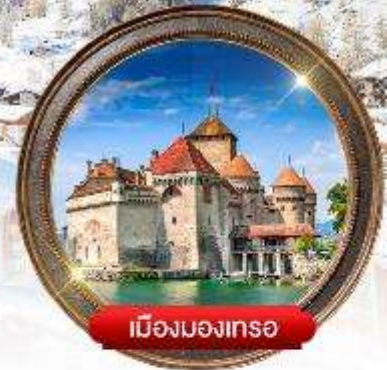
เมืองมงเทรซ