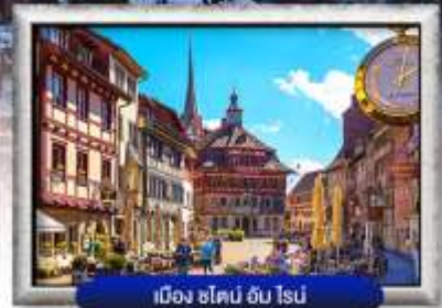
เมือง ซ็ไตน์ อัม โรน