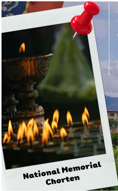
National Memorial Chorten