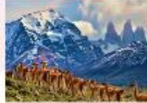
อุทยานแห่งชาติตอร์เรส เดล เพน