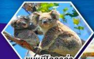
ชมหมีโคอาล่า ณ สวนสัตว์ซิดนีย์