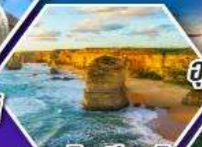
เกรทโอเซียนโรด