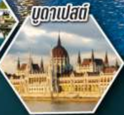
บูดาเปสต์