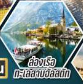
ล่องเรือ ทะเลสาบอัลสติก