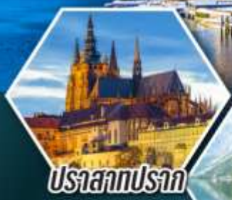
ปราสาทปราก