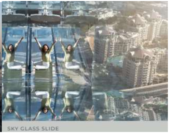
SKY GLASS SLIDE

ได้เวลาพอสมควรนำท่านเดินทางสู่ สนามบินดูไบ เพื่อเดินทางกลับสู่ กรุงเทพฯ