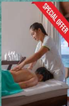
SPA 30 mins