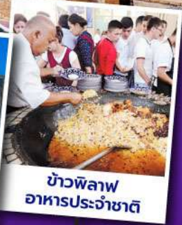
ข้าวพิลอฟ อาหารประจำชาติ