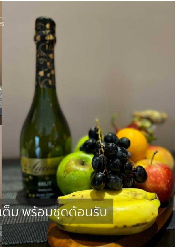
ภายในวิลล่า Minibar จัดเต็ม พร้อมชุดต้อนรับ